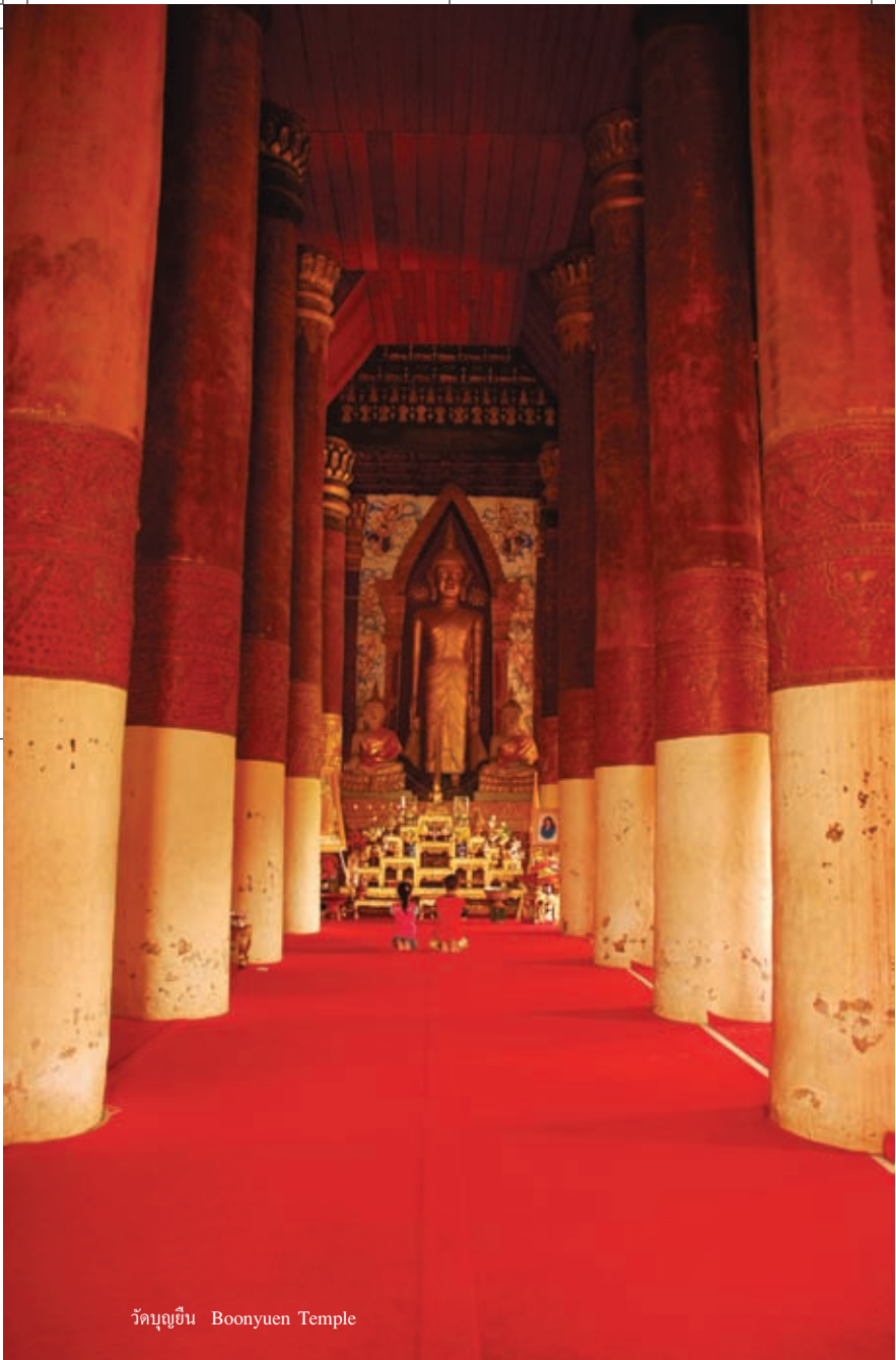
วัดบุญยืน Boonyuen Temple