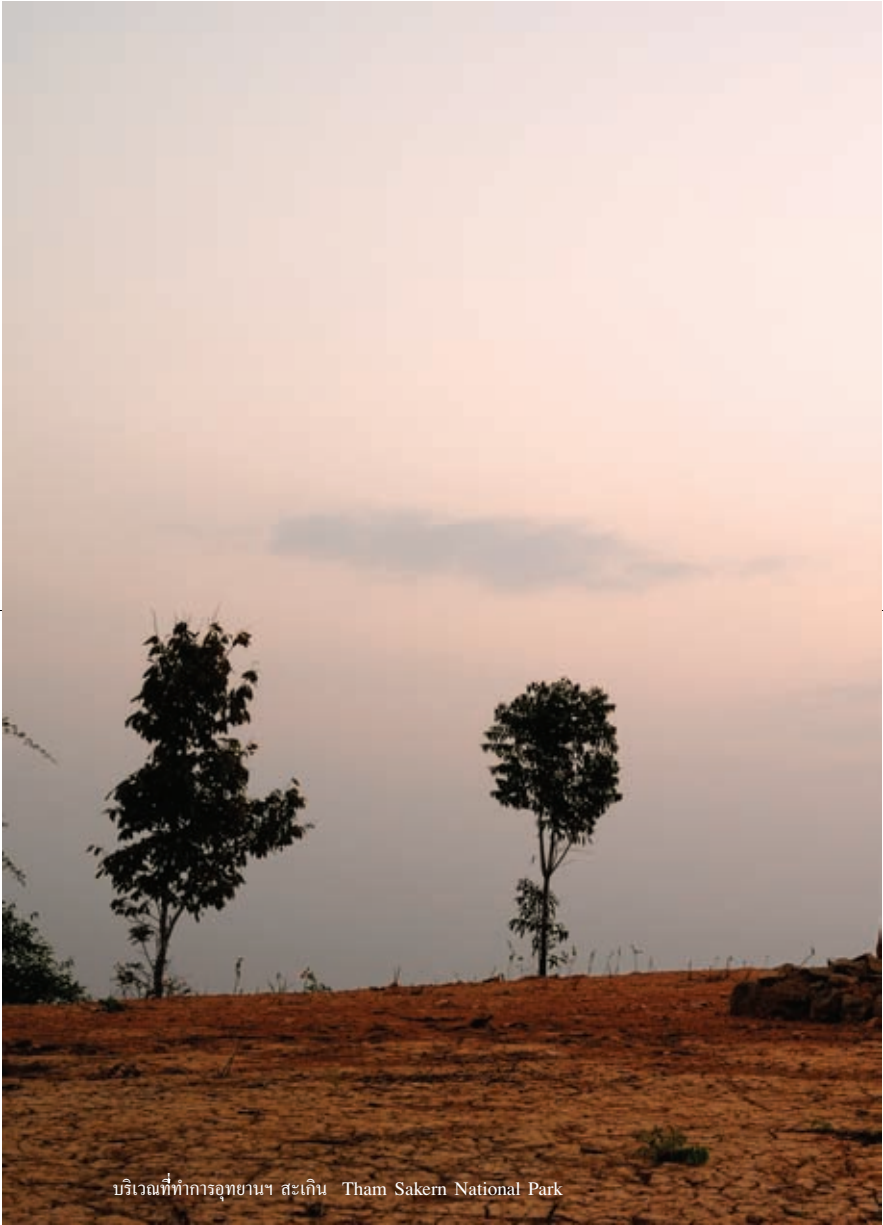
บริเวณที่ทำการอุทยานฯ สะเก็น Tham Sakern National Park