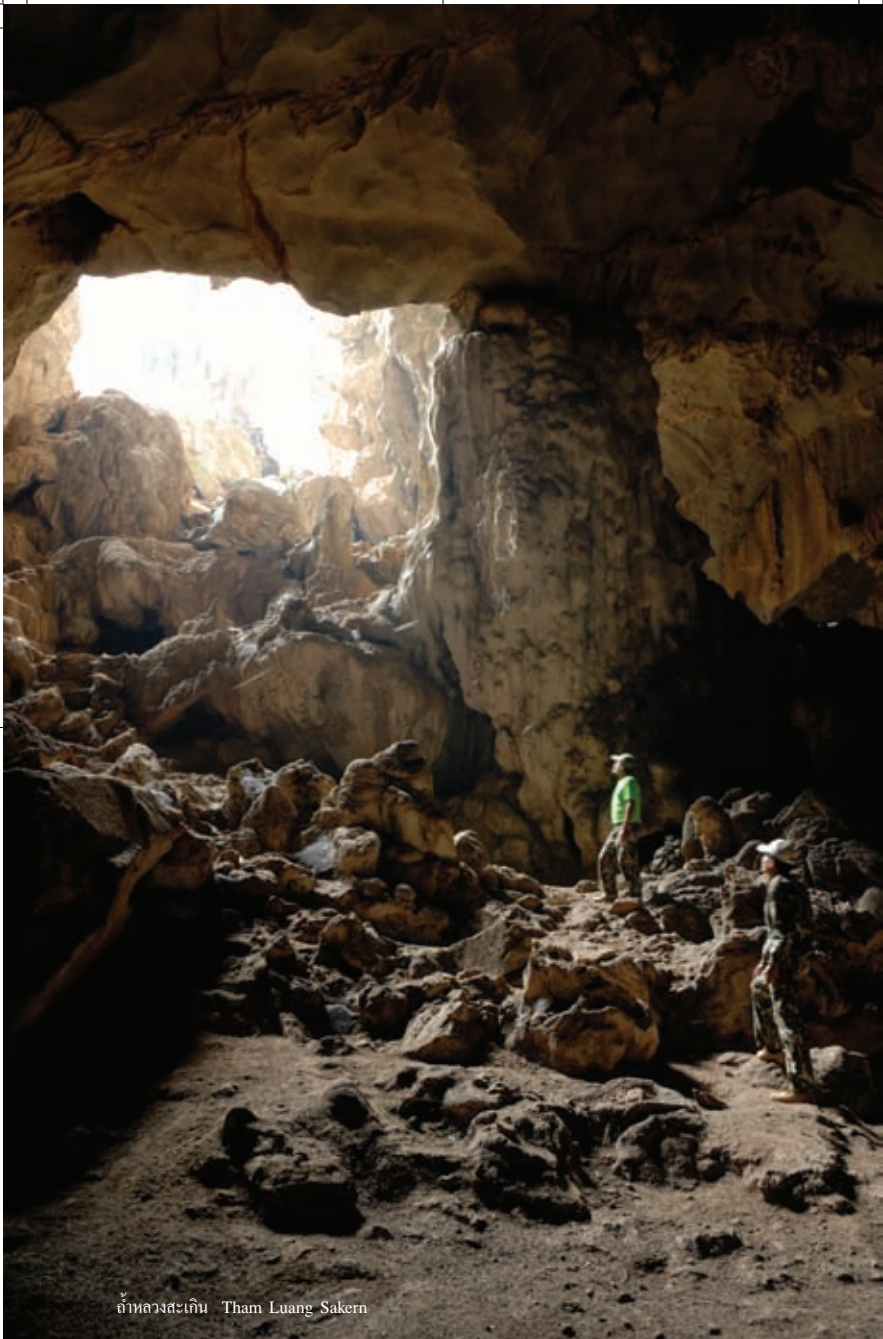
ถ้ำหลวงสะเทิน Tham Luang Sakern